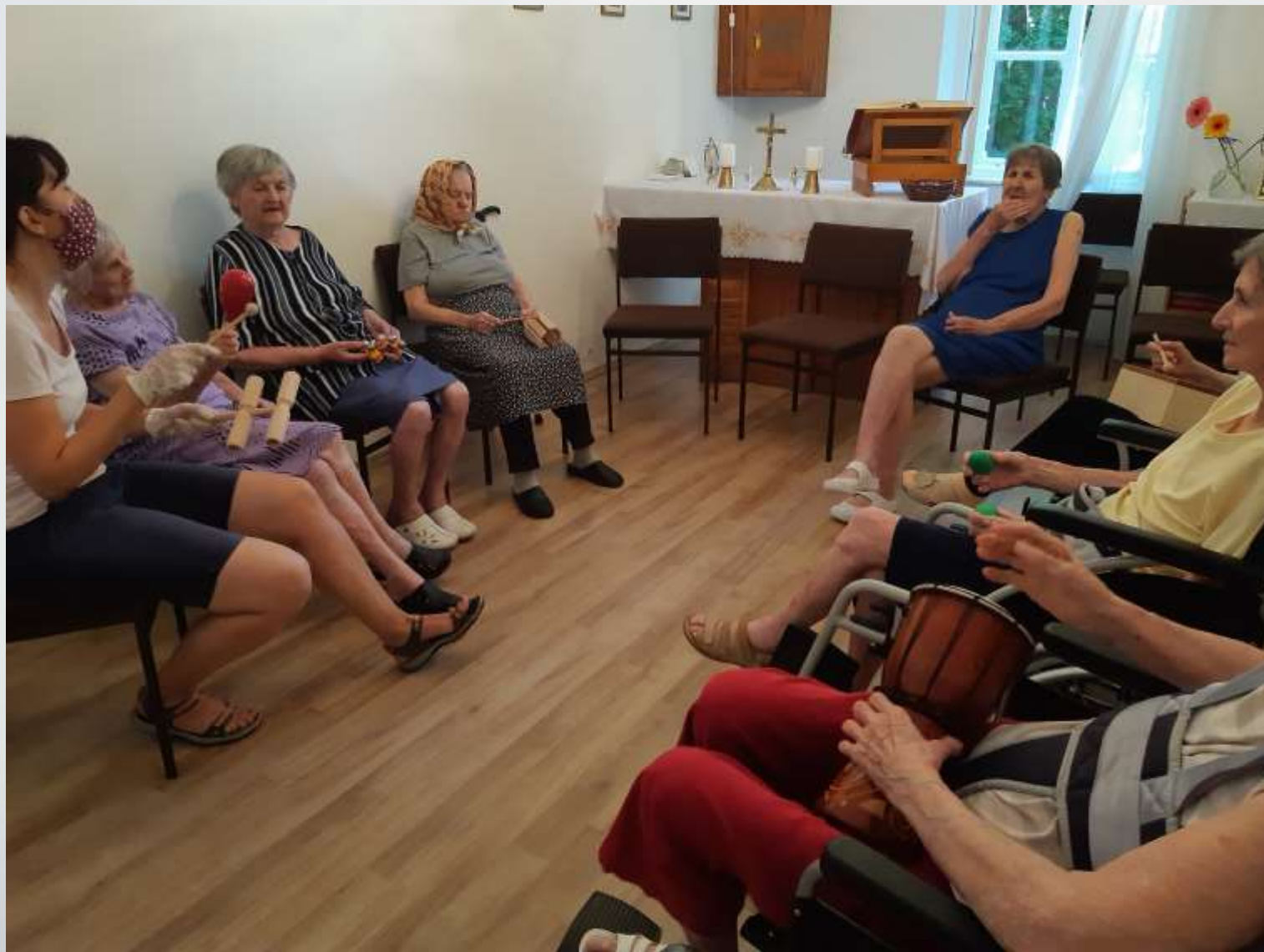
Közös hangszeres játék, közben közös dalok éneklése